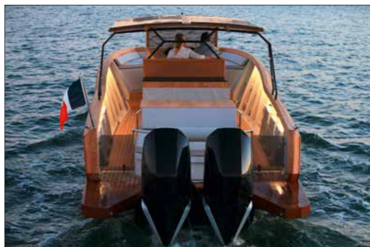
Symétrie parfaite pour le plan de pont du Picnic 10 Open. Dépouillement peut parfois aussi rimer avec fonctionnalité.

board. Le gain en nombre d'heures de travail est loin d'être négligeable, d'où un prix final forcément plus abordable qu'un grand picnic Open. Cette approche va de pair avec un plan de pont presque simplifié où l'on cherche à mettre en avant la noblesse du bois et rien d'autre. Volontairement, les membrures étaient ap-